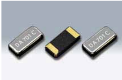
原寸大 □ DST310S